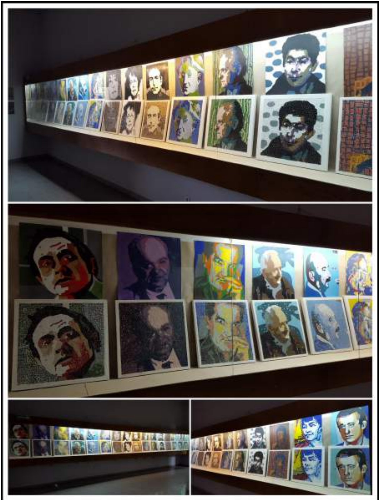
„Mozaika” wystawa towarzysząca obchodom jubileuszu 70-lecia ASP im. E. Gepperta we Wrocławiu, projekty i realizacje studentów pracowni Technologii Malarstwa sztalugowego, Organicznych Technik Malarskich i Mozaiki – projekt kuratorski, 2016