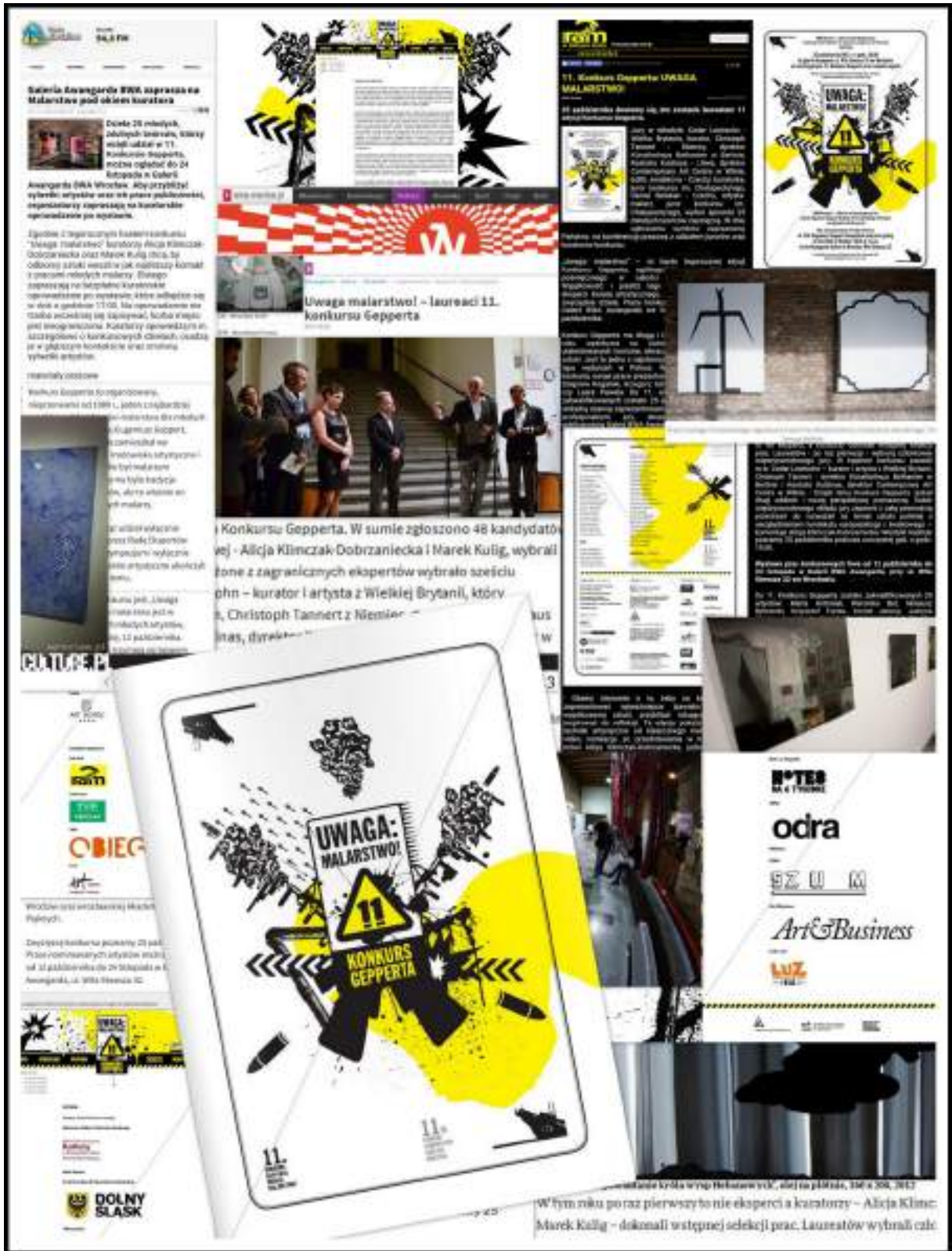
Pelnienie funkcji kuratora generalnego „11. Konkursu Gepperta”, 2013