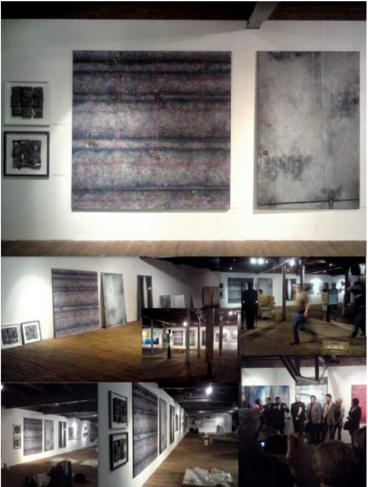
Pełnienie funkcji kuratora technicznego wystawy dydaktyków ASP im. E. Gepperta we Wrocławiu „WRO-POZ, POZ-WRO WROCLAW NIE DO POZNANIA”, Stary Browar, Poznań, 2010